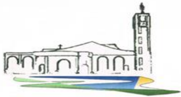
Parrocchia Buon Pastore Caserta